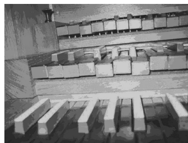
État des claviers au 20 février