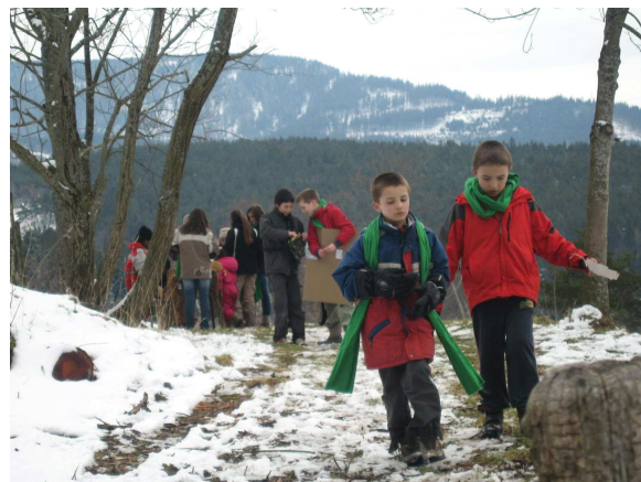
Jeu d'extérieur sous la neige