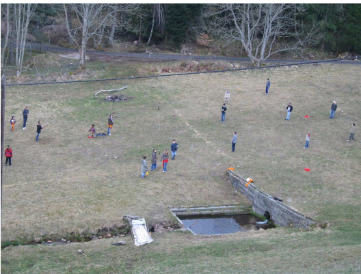
La thèque, un jeu toujours aimé