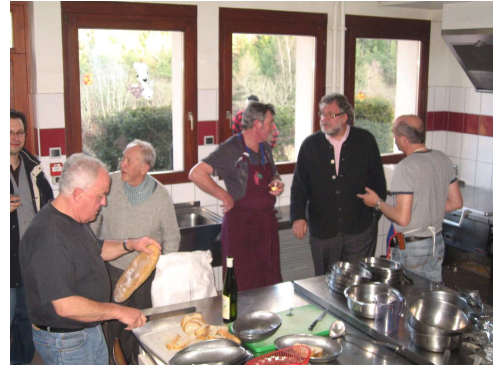
L'équipe de cuisine : efficacité et bonne humeur