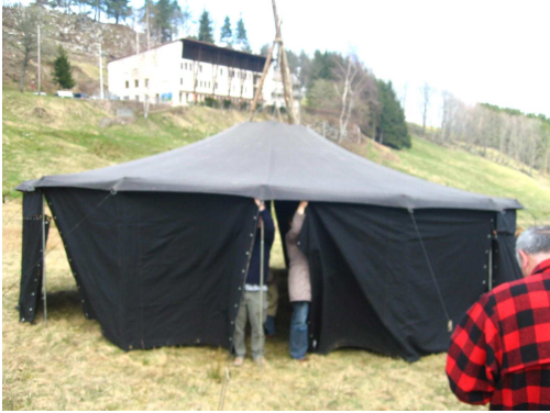
Montage de la yourte, le campement d'Abraham