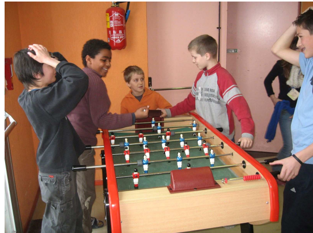
Le baby-foot, une valeur sûre